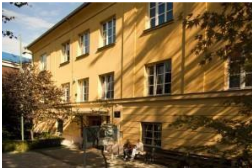
Slika 1. Centralna zgrada Veleučilišta

Studiji na veleučilištu organizirani su kao redoviti i neki kao izvanredni. Na obje vrste studija tijekom akademske godine na Zdravstvenom veleučilištu, studira oko 4 000 studenata. Nastavu izvode nastavnici i suradnici u dopunskom radu i zaposlenih po ugovoru o radu.