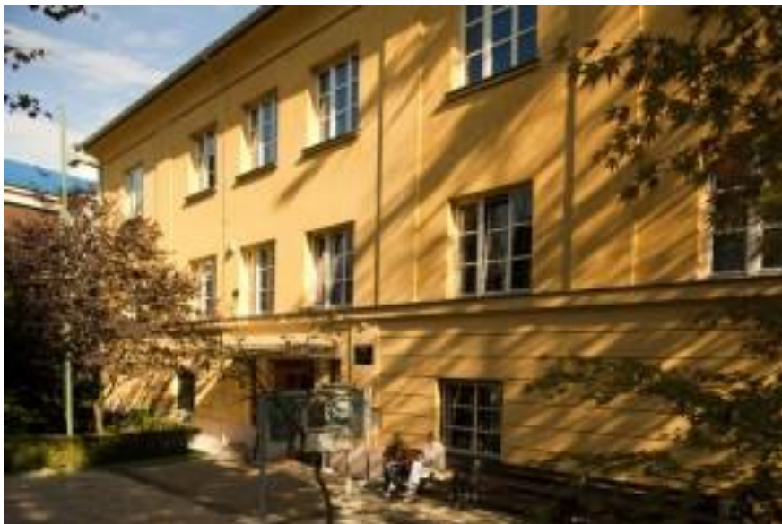
Slika 2. Centralna zgrada Veleučilišta

Studiji na Zdravstvenom veleučilištu organizirani su kao redoviti i izvanredni. Na obje vrste studija u 2011/2012. godini na Zdravstvenom veleučilištu, studira oko 3 000 studenata, od čega se oko 50% odnosi na studente starije od 25 godina, što samo potvrđuje orijentaciju Zdravstvenog veleučilišta ka cjeloživotnom obrazovanju. Nastavu izvodi oko 500 izabranih nastavnika i asistenta u stalnom, kumulativnom i dopunskom radnom odnosu. Treba naglasiti kako je većina nastavnog kadra obrazovana upravo unutar struke čija znanja i vještine prenose na studente na određenom studiju. Teoretska nastava se izvodi u prostorima Zdravstvenog veleučilišta na Ksaveru 209, Ksaveru 196a i Mlinarskoj cesti 38, a praktična na 50-tak nastavnih radilišta u suradničkim zdravstvenim i srodnim ustanovama, ugovorenim nastavnim radilištima Zdravstvenog veleučilišta. Najveći broj vanjskih nastavnika je stekao izborno zvanje sudjelujući u nastavnom procesu na studijima Veleučilišta i postupcima izbora u zvanje provedenih na Veleučilištu. Na taj način je Veleučilište oblikovalo profil vanjskih nastavnika sukladno kriterijima i nastavnoj tehnologiji. Nastavnici različitog spektra znanstveno stručnih kvaliteta svrstani u katedre provode nastavu i bave se znanstveno-istraživačkim radom. Posebnu pozornost nastavnici posvećuju mentorskom radu sa studentima i poticanju njihove samostalnosti rada i uključivanja u stručni rad.