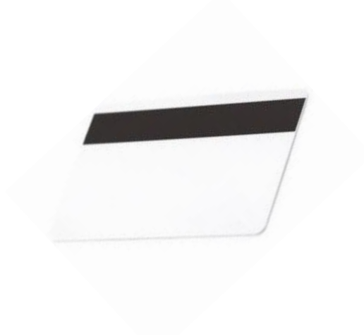
Slika 3. Čitač kartice i magnetni dio e-indexa

Materijal koji ste pustili na ispis automatski počinje izlaziti na kopirnom uređaju. Na kraju obavezno pritisnite tipku ID da biste se odjavili i kako bi spriječili drugom korisniku korištenje vaših kredita.