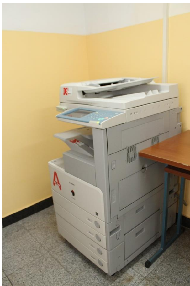
Kopirni uređaj na lokaciji Mlinarska cesta 38